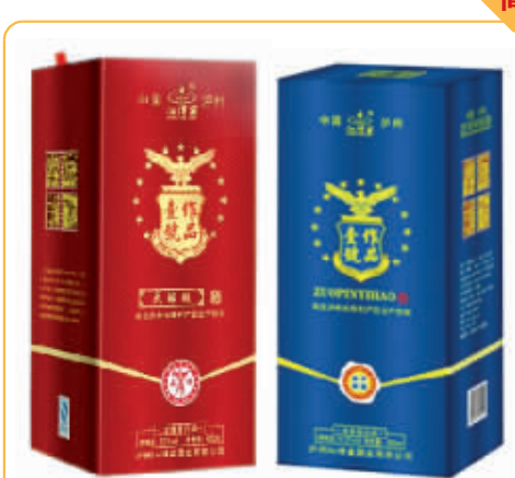
品名:作品壹号系列