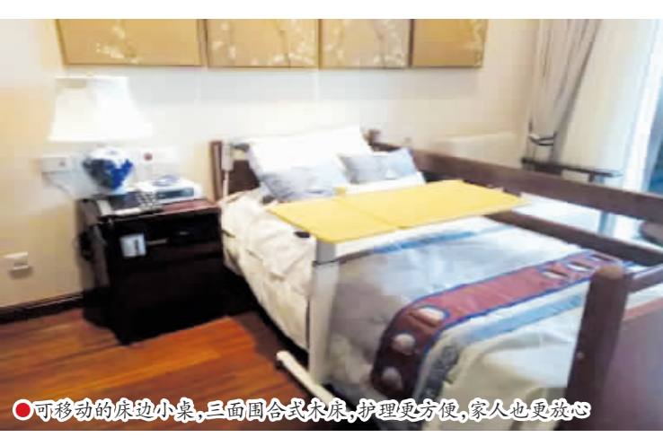
可移动的床边小桌, 三面围合式床框, 护理更方便, 老人也更安心