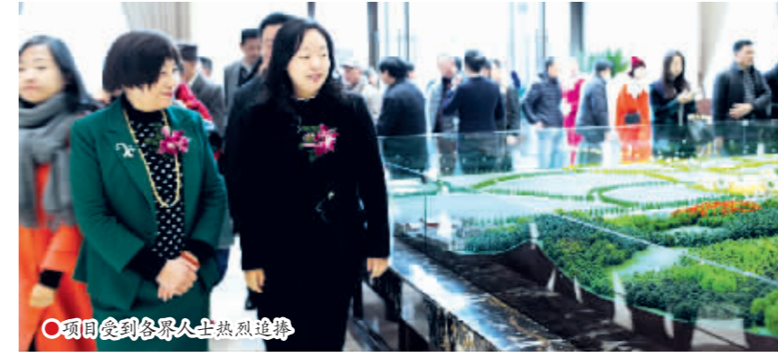
项目受到各界人士热烈追捧