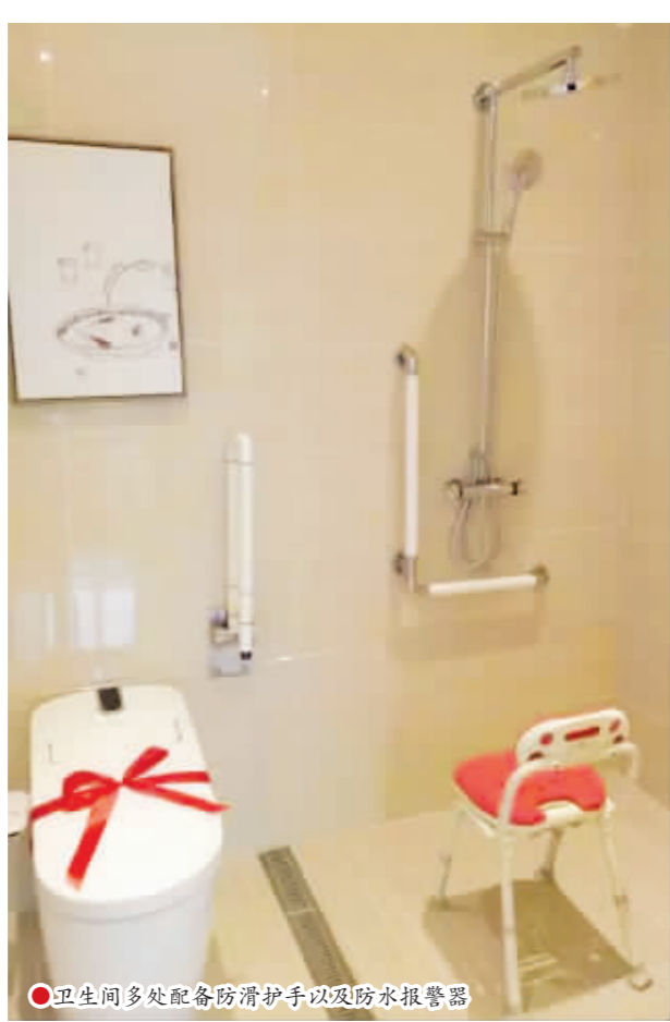
卫生间多处配备消毒护手以及防水报警器

由地方政府主导, 以中国老年医学学会和解放军总医院健康管理研究院作业和技术支撑, 由成都市康乐投资管理有限责任公司巨资兴建的西南高端医养结合示范基地——中国青城国际颐养中心, 近日在青城山麓凤栖山 5A 旅游风景区核心区, 有“最美古镇”之称的千年古镇——崇州市街子镇精彩亮相。