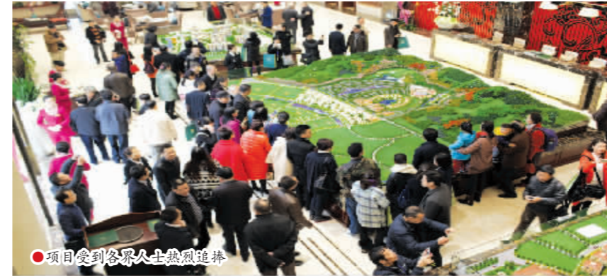
项目受到各界人士热烈追捧