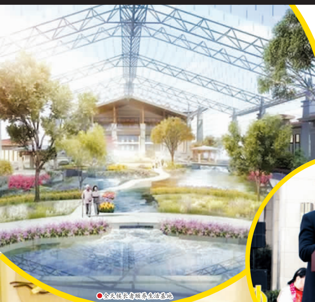
全天候长者颐养生活基地

今日 12 版 第 004 期 总第 8755 期 国内统一刊号: CN51-0098 邮发代号: 61-85 全年定价: 450 元 零售价: 2.00 元