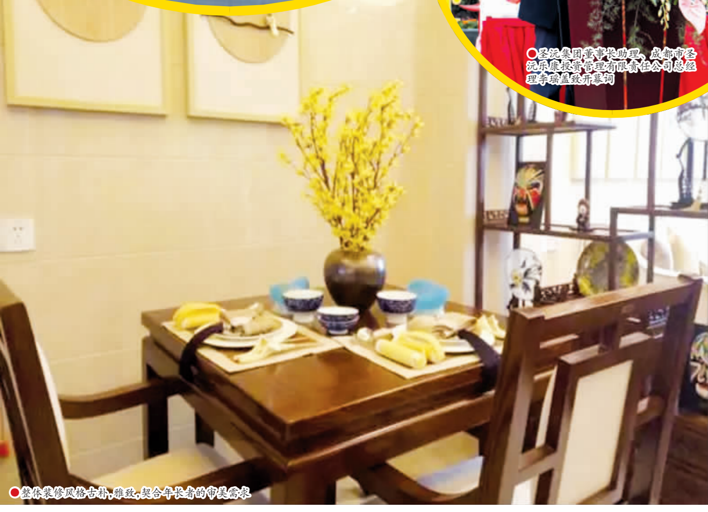
整体装修风格古朴、雅致, 迎合长者审美需求