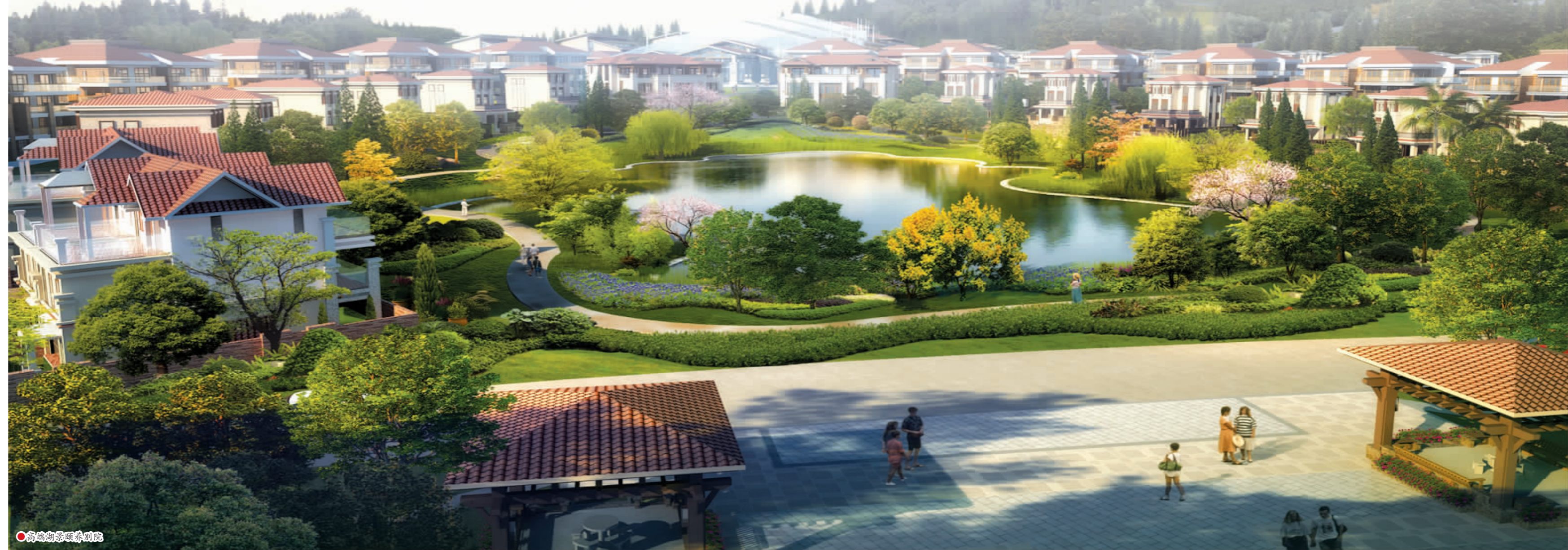
高端湖景颐养别墅院