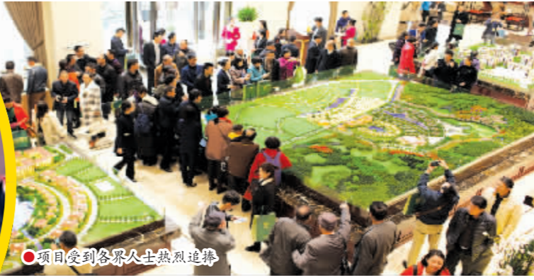
项目受到各界人士热烈追捧