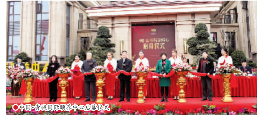
中国·青城国际颐养中心启动仪式