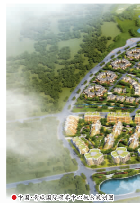
中国·青城国际颐养中心概念规划图

医养组团集老年健康体检和专病治疗、康复、疗养、养生和最新生命科学研究成果应用为一体, 组团内包含一座按国家三甲综合医院标准建设的, 以老年专病医疗、康复为特色的医院, 一个健康体检中心和一个抗衰老生命科学研究院院士工作站, 通过解放军总医院健康管理研究院设在颐养中心的远程健康咨询平台, 提供远程专病咨询、病理会诊、远程影像、心电和医疗直通渠