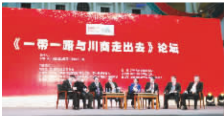
●“一带一路”与川商走出去圆桌论坛

试验区之一,加上地处国家实施“一带一路”和长江经济带建设战略的核心交汇点,四川迎来快速发展的红利;成都被定位为六大国家中心城市之一,天府新区上升为国家级新区,成都高新区获批建设国家自主创新示范区,绵阳科技城比照执行中关村先行先试政策,攀西地区是全国唯一的战略资源创新开发试验区……投资四川已成为广泛共识。