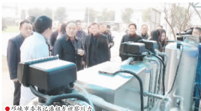
●邛崃市委书记潘祖龙视察川力

认识到,企业的快速发展要引领员工成长,只有让员工从社会自由人进化成有纪律,懂得按标准、流程、规则做事的公司人,企业才能有战斗力,所以他们在员工的专业上提升其技能,职场上规范其行为,身心上让其健康快乐,收入上让其年年有增长。