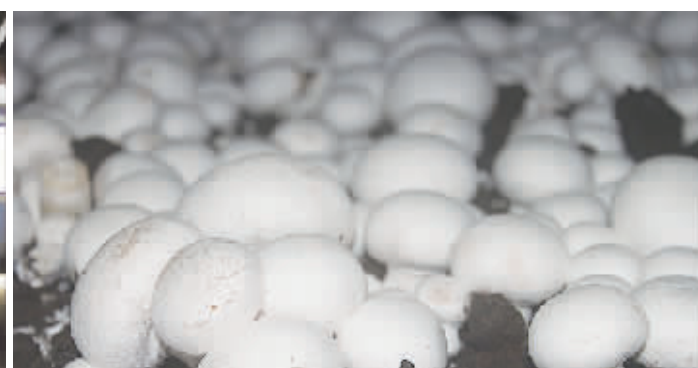
●江苏裕灌现代农业科技有限公司白蘑菇种植基地。