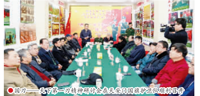
国刀——天下第一刀精神研讨会在天安门国旗护卫队顺利召开