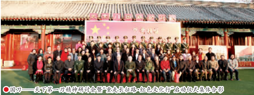
国刀——天下第一刀精神研讨会暨“重走长征路·红色文化行”启动仪式集体合影