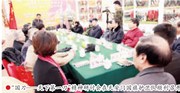
“国刀——天下第一刀”精神研讨会在天安门国旗护卫队顺利召开