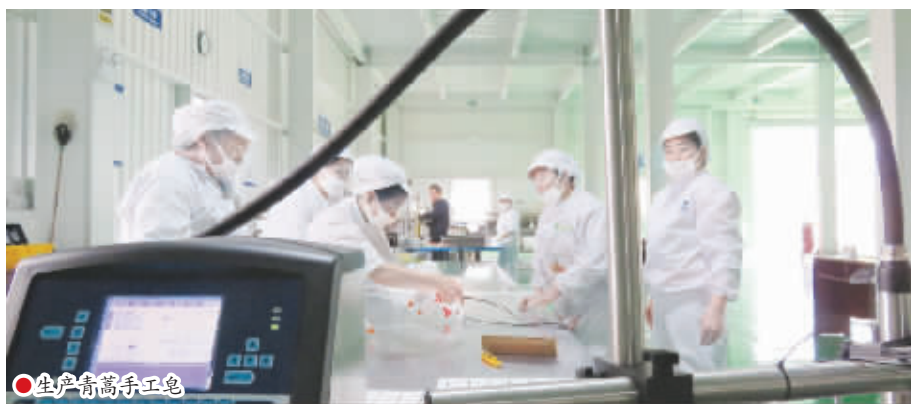
1:20, 利润微薄,无法支撑企业持续发展,中国青蒿素原料供应企业是在为外国人打工。

四川蓝伯特生物科技股份有限公司近年来抓住经济结构跨越转型的契机,建设了专业致力于植物提取物及天然活性有效成分的研发、生产和销售为一体的生物科技公司。公司可提取以青蒿素为代表的医药中间体 30 到 50 吨,主要为下游企业提供原料和半成品。然而,目前青蒿素类药品的成品制造专利大多掌握在瑞士诺华、法国赛诺菲等制药“巨头”手中,青蒿素原料和成药销售利润约为