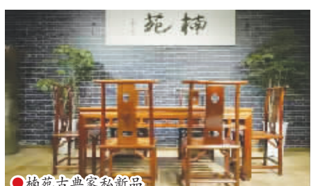
楠苑古典家具新品

楠苑古典家具公司生产总部所在的宜宾筠连县地处乌蒙山余脉,由于气候温和,湿度适宜,非常适合楠木的生长。由于明清两朝,金丝楠木被钦定为皇家御用之木,经大量砍