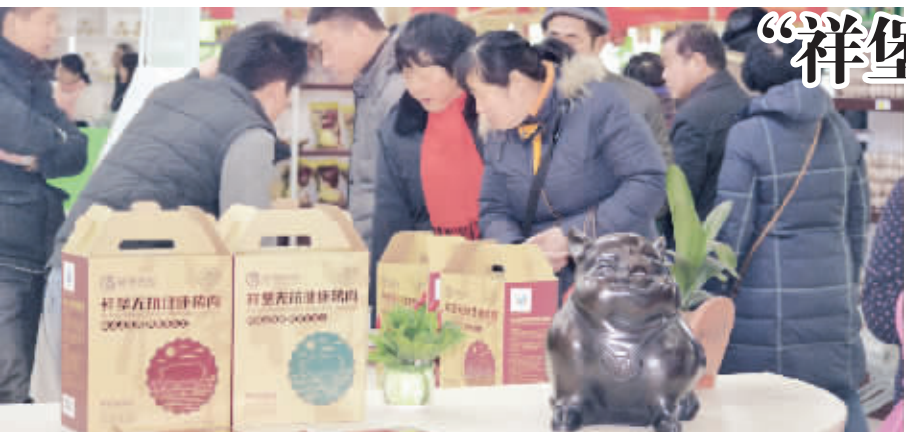
祥堡无抗生素猪肉直营店吸引大量顾客前来购买

因此,虽然各方都在积极往拆分的方向走,但能否真正达成拆分,或许还要时间来检验。(史燕君)