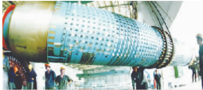
●图为兴泰发电的节能、节水改造。