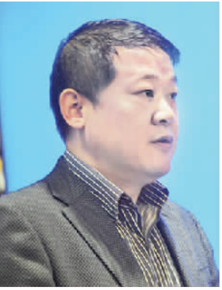
我们举办四川省中小微企业“双创”服务联盟成立暨 2016 重点项目融资对接活动,既是我省贯彻落实国务院和省省委省政府关于全面推进大众创业、万众创新的决策部署,持续深入推进“四川省中小微企业创新创业三年行动计划”的重要举措,也是我省大众创业万众创新活动周的重要环节。

(本文系作者在四川省中小微企业“双创”服务联盟成立暨 2016 创新创业融资对接活动上的讲话)