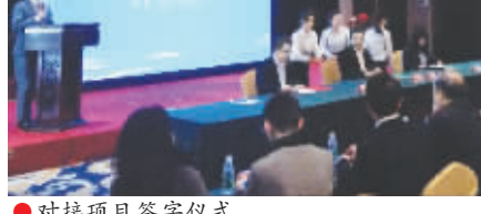
对接项目签约仪式