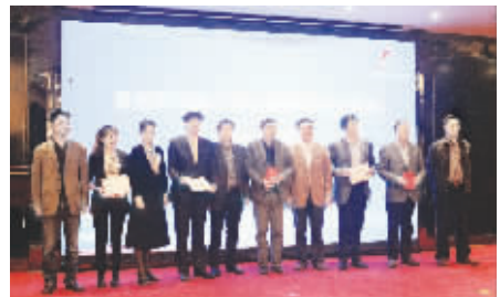
为双创导师代表颁发聘书