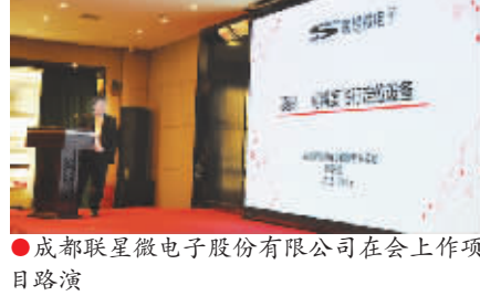
成都联星微电子股份有限公司在会上作项目路演