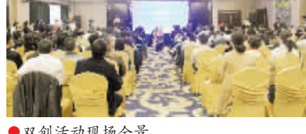
双创活动现场全景