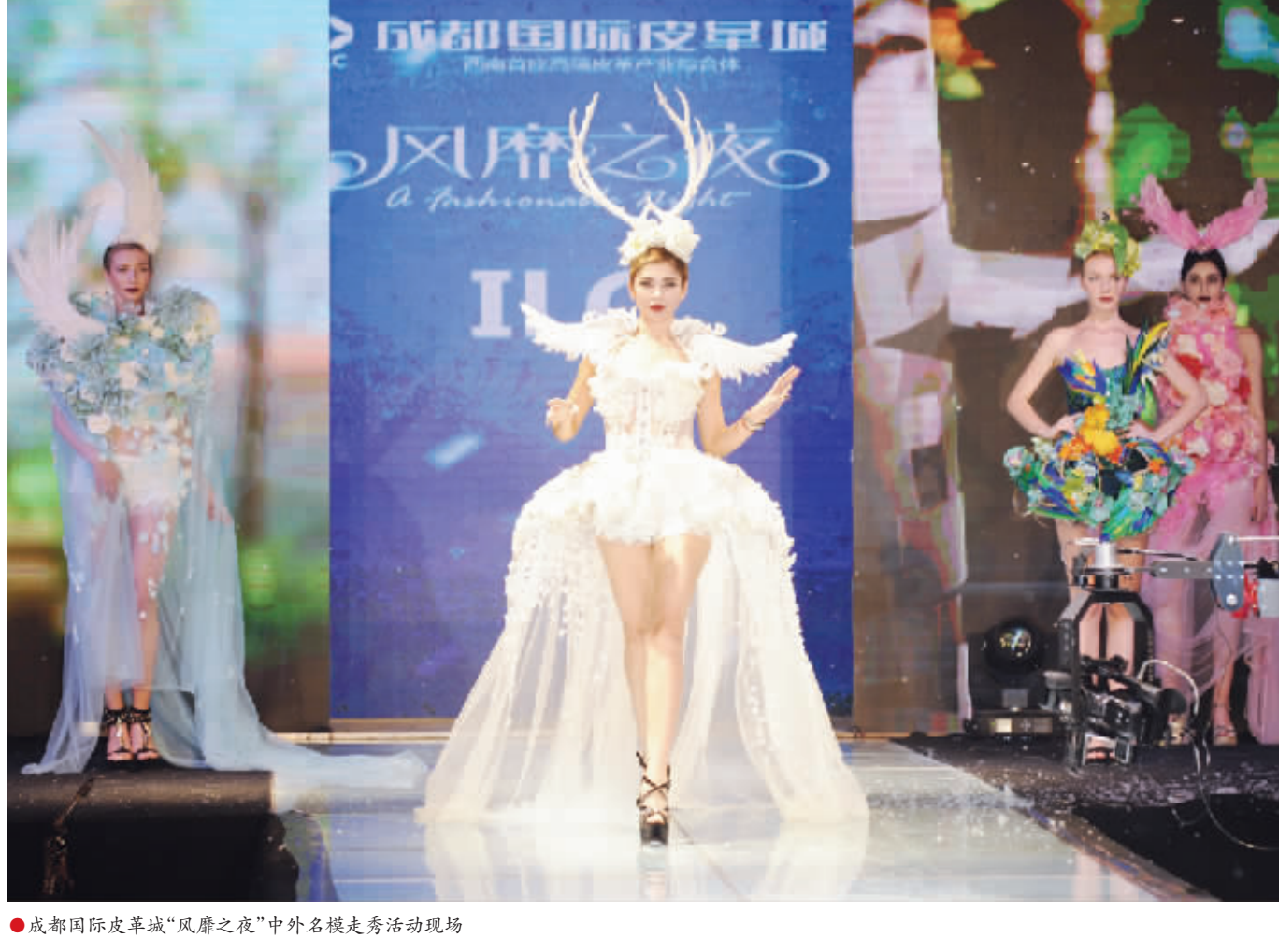
●成都国际皮革城“风靡之夜”中外名模走秀活动现场

运营方聘请国际化的设计师团队,以国际化的视野,牺牲了大面积的空间,打造了16米层高无柱体宴会厅、可容纳1600人巨型宴会厅、屋顶草坪婚庆广场、彩化空中园林等特色景观。