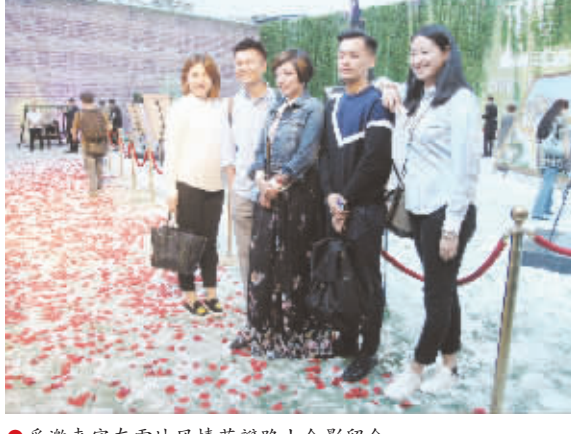
●受邀来客在雪地风情花瓣路上合影留念