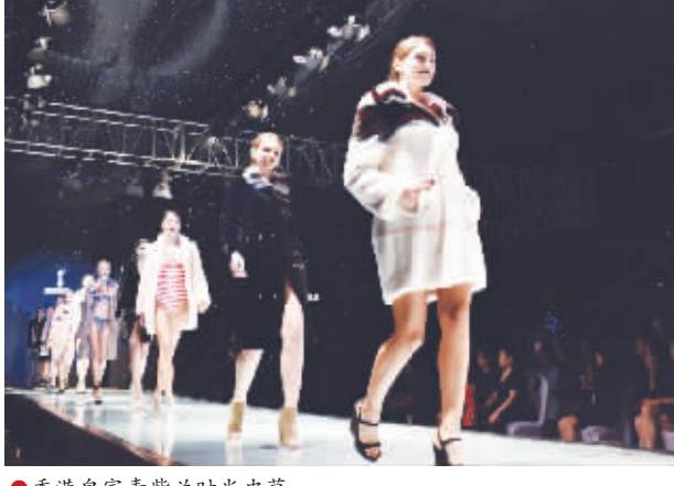
●香港皇家青紫兰时尚皮革