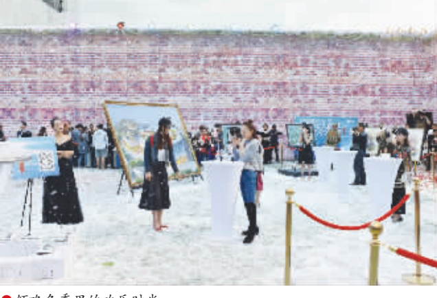
●领略冬季里的欢乐时光