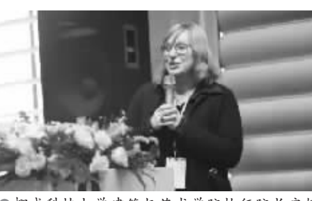
●挪威科技大学建筑与艺术学院执行院长安娜·尼克曼斯

建筑和城市化项目案例”、“近零能耗建筑的一小步——贵安清控人居科技示范楼”、“中欧合作历史街区的建筑节能更新”、“中国绿色校园的发展与思考”等展开主题报告。