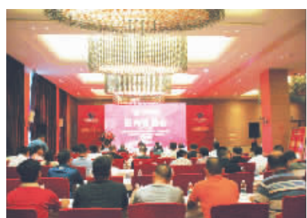
万洋众创城招商说明会现场

记者在近日由金华万洋众创城开发有限公司和金华温州总商会的举办，义乌市秘书长俱乐部和浙商银行协办的万洋众创城招商说明会上了解到，由温州万洋集团投资，金华万洋众创城开发有限公司在金华浦江打造的“万洋众创城”是浦江县委县政府的重点工程项目，它的建设将为引导浦江挂锁产业转型升级，推动浦江从“挂锁大县”向“挂锁强县”发展发挥重要作用。