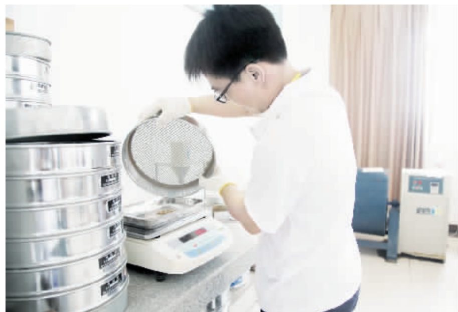
●图为检测人员在进行检测试验

2015年新年伊始,赵瑞祥一方面发动检测中心的同志用足人脉,广揽八方信息,一方面精心筹划检测中心如何参与市场竞争,一方面加强与武汉地区兄弟建筑施工企业联系,打造合作基础,争取首先从武汉地区开始破题。试验室的员工更是针对高速铁路、城市