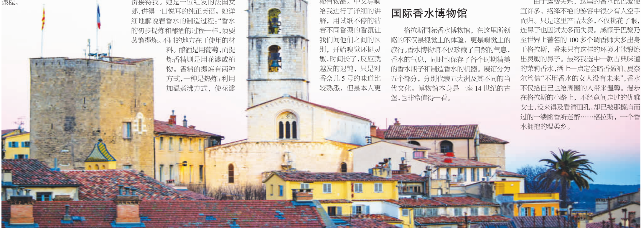
●本版图片为美丽的法国香水小镇格拉斯美丽的风光等。

由于运费关系,这里的香水比巴黎便宜许多,络绎不绝的游客中很少有人空手而归。只是这里产品太多,不仅挑花了眼,连鼻子也因试太多而失灵。感慨于巴黎乃至世界上著名的100多个调香师大多出身于格拉斯,看来只有这样的环境才能锻炼出灵敏的鼻子。最终我选中一款古典味道的茉莉香水,洒上一点定会暗香盈袖。夏奈尔笃信“不用香水的女人没有未来”,香水不仅给自己也给周围的人带来温馨。漫步在格拉斯的小路上,不经意间走过的优雅女士,没来得及看清面孔,却已被那擦肩而过的一缕幽香所陶醉……格拉斯,一个香水拥抱的温柔乡。