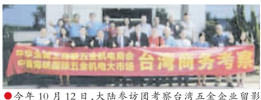
●今年10月12日,大陆参访团考察台湾五金企业留影