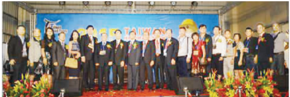
●参访团与台湾手工具公会领导合影。