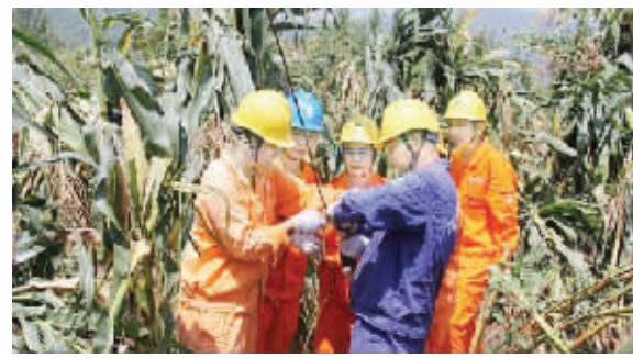
● 电力员工正在进行紧张的线路抢修。