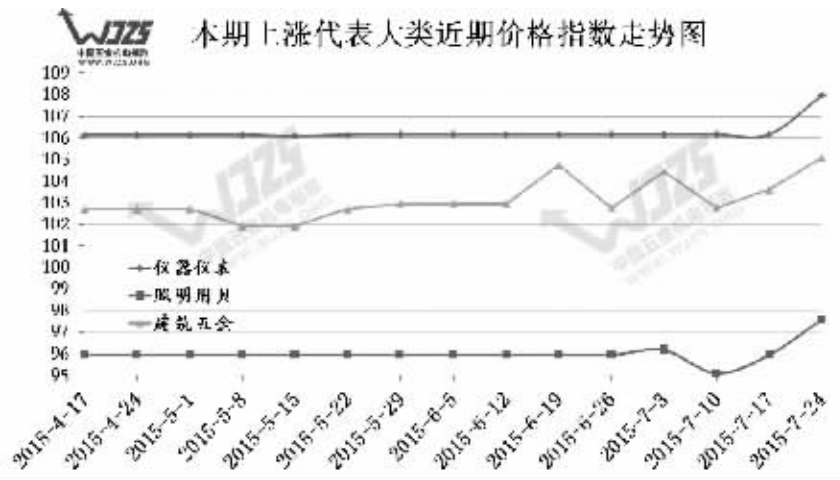
1、“仪器仪表”价格指数一改长期平稳趋势 本周明显上升

(一)涨幅方面:本周十二大类中共有十个大类价格指数上升,五个大类涨幅超过一个百分点。涨幅前三位分别是“仪器仪表”、“照明用具”以及“建筑五金”,“仪器仪表”环比上升1.81点,涨幅相对最大,下面是本周涨幅前三类近期价格指数走势图: