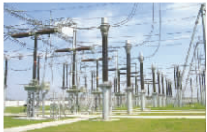
成“五纵五横”特高压电网,合计27条特高压线路。

近日,途经甘肃、陕西、重庆、湖北、湖南5个省市的酒泉-湖南±800千伏特高压直流输电工程(以下简称“酒泉-湖南工程”)正式开工。国家电网2015年计划在国内核准建设“六交八直”14条线路,目前已经开工4条线路;到2020年计划在国内建