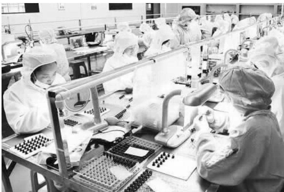
“光电引擎”驱动遂宁工业转型升级

据凉山州统计局分析,该州投资规模正呈现稳步增长的态势,工业经济降幅明显收窄,房地产市场回暖上扬,服务业保持较高增长。在此背景下,GDP 增速能否大幅回升,在市州排名中又能“收复”多少位次,也值得关注。