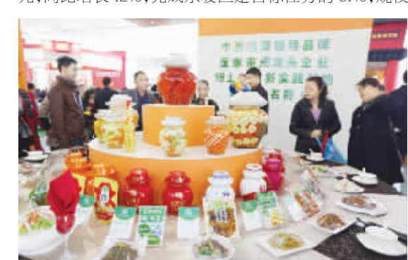
●眉山中国泡菜城产业园区销售收入实现35亿元

此外,该产业园区招商引资实际到位资金27.5亿元,同比增长12%,完成东坡区定目标任务的61%;规