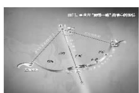
图二:四川与“一带一路”、与长江经济带的关系(发射点)

专家分析四川省物流业发展现状,形成了一些共同认识。(一)存在的主要问题是:一是物流成本居高不下;二是物流基础设施效率低下,高速公路与铁路擦肩而过,高速公路、铁路没有进物流园区,长江水道等级过低,航空物流不配套;三是集约经营水平不高;四是市场主体“散、小、弱”突出,物流企业普遍存在规模不大等级不高的问题;物流企业内部现代化有待提升;第三方企业比重较低;物流资源有待整合。(二)面临的新挑战是:一是实体经济困难;二是土地控制更加严格,成本上升;三是周边竞争激烈。(三)面临的新机遇是:一是独特区位优势带来新机遇——四川位于“一带一路”交汇点,是连接