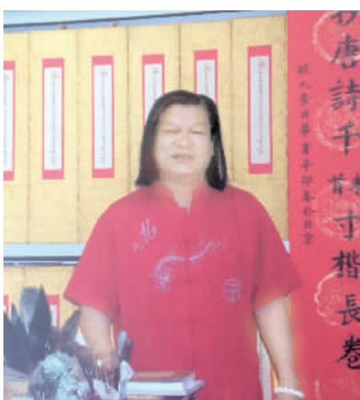
世界和平文化使者著名书法家查日华