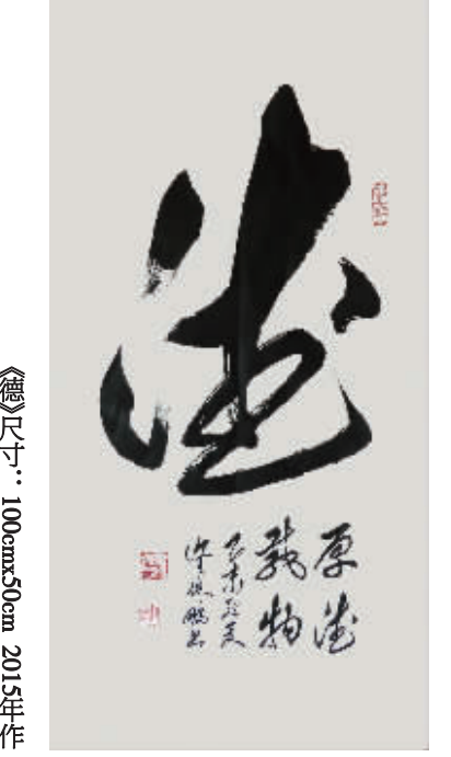
《造》尺寸: 100cmx50cm 2015年作