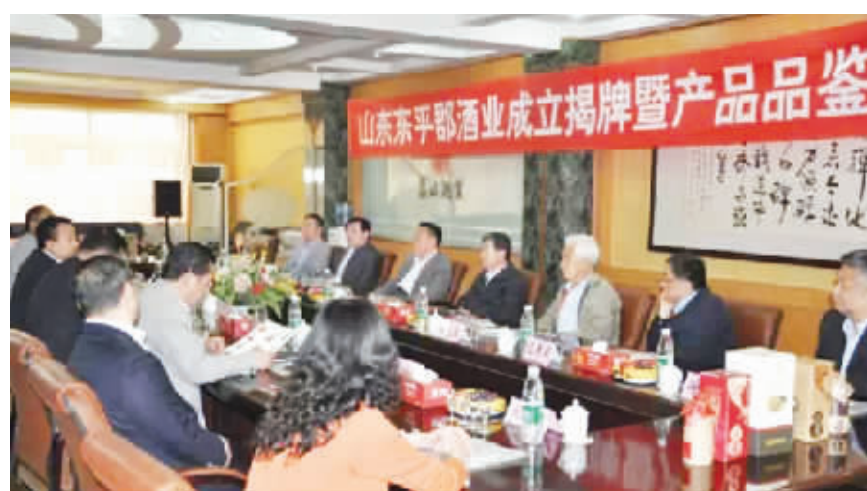
●东平郡酒业揭牌仪式现场

随后,作为泰山酒业70周年庆典活动的一部分,东平郡酒业成立揭牌仪式正式开始。王延才理事长和季克良先生共同为东平郡酒业揭牌,标志着山东东平郡酒业有限公司正式成立。