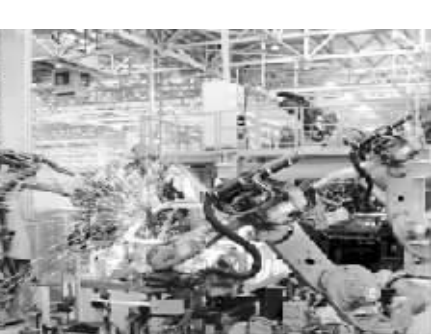
●图为北汽股份公司北京分公司,机器人在流水线上焊接自主品牌绅宝汽车。

东北地区等传统工业基地产业基础雄厚、人才资源密集,正瞄准先进技术加紧进行改造升级,通过智能机器人提高各产业的数字化和智能化水平,应对产业升级挑战。已有大批著名机器人企业扎根东北,由辽宁某机器人企业研发的国内首条热冲压机器人自动化生产线日前诞生,首届中国沈阳国际机器人展览会也将于9月份举办。一直埋首深耕机器人领域的沈阳新松机器人自动化股份有限公司,自从移动机器人系统在沈阳金杯汽车公司首次投入使用后,就不断开发新产品,如今已占领国内市场九成以上份额,还出口到15个国家。河南省由省工信厅牵头,组织20余家单位发起成立河南省机器人产业联盟,将在2020年把河南打造成全国最具规模、最具竞争力的工业机器人和智能装备产