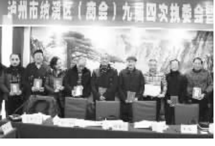
泸州市纳溪区工商联(商会)在“企业家活动日”表彰优秀企业家。

此外,纳溪区工商联(商会)还组织会员企业家参加形式多样的健康活动,比如每年举办4次固定的执委会联谊活动。通过活动增进企业之间、企业家之间的沟通与了解。同时组织企业家分赴区内外或境外学习考察,5年来共有100多人参与省外考察学习,有30人参与境外考察学习,为参与者提供了学习先进,开阔眼界、启发思路的机会。(李小波)