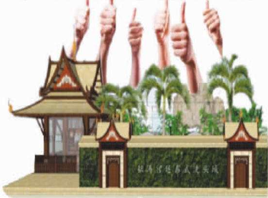
耘涛美业新城外观(侧面)

打造企业、员工、消费者全员股东化 践行商场理念、超市模式 实施技术服务流程改造 融入泰式洗理健康产业 形成人们新的生活方式