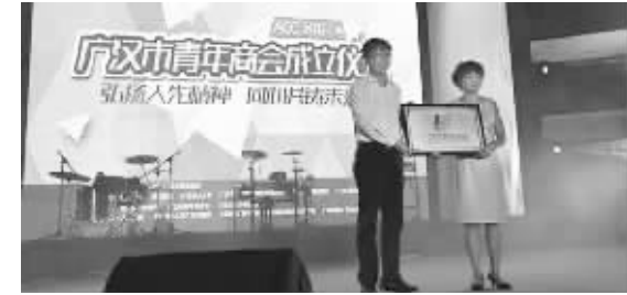
●广汉市青年商会授牌成立

据介绍,寻找“广汉最美创客”活动将在全社会发起“最美广汉创客”大搜索活动,寻找广汉草根创业者和广汉民间的创新力量。并将在2016年5月4日组织“广汉创客高峰论坛”,共同分享创客们的创业经历和故事,分享他们的人生感悟和喜悦。