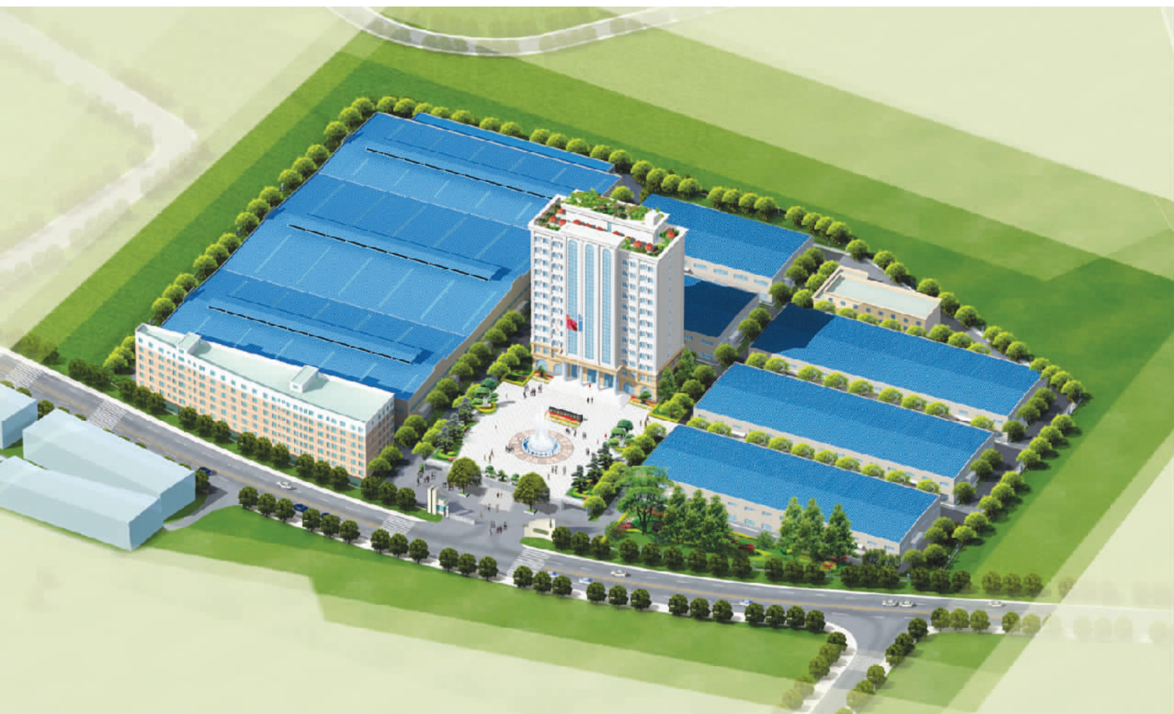
●乐尔佳公司整体效果图

近20年,王连铭向98洪灾、“5.12”汶川地震、玉树地震、舟曲泥石流、雅安地震灾区捐款253万元,捐资20多万元使15名贫困学生圆了大学梦,每年捐资10多万元帮助企业职工及周边村民解决受灾、患病、生活等困难。