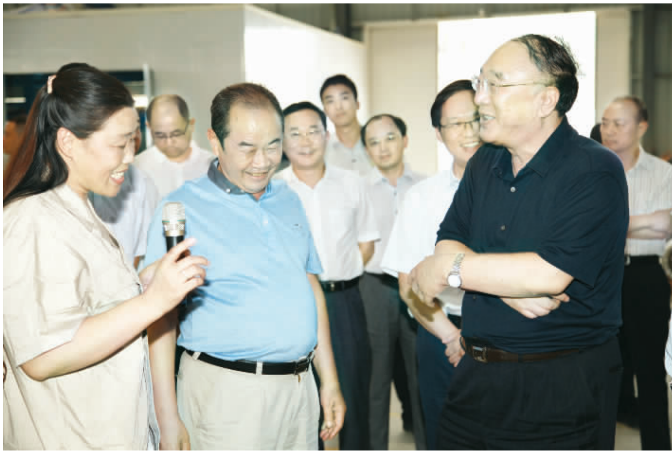
●重庆市市长黄奇帆(右一)到乐尔佳公司视察

2009年3月,王连铭投入资金3000万元将原湖北咸丰县鑫宇机械制造安装有限公司、咸丰天燃电器制造有限公司2个小作坊企业进行收购、整合,入驻重庆市正阳工业园