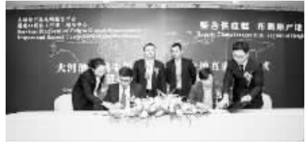
●大河酒城与源宜购海外原产地直采签约仪式现场

服务平台,对大河酒城连锁实现与海外酒庄的直接跨境贸易对接具有重要意义,使大河酒城连锁在原有直通上游的采购渠道基础上,增加了更多海外名优红酒酒庄的原产地采购。“这样不但可以使大河酒城连锁更加有效地掌控进口酒产品品质及各种顶层优质资源,还能更好地为大河酒城连锁消费