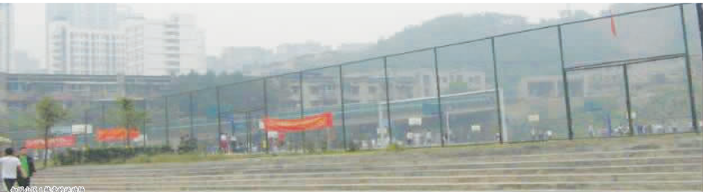
知园小区 1 栋旁的运动场