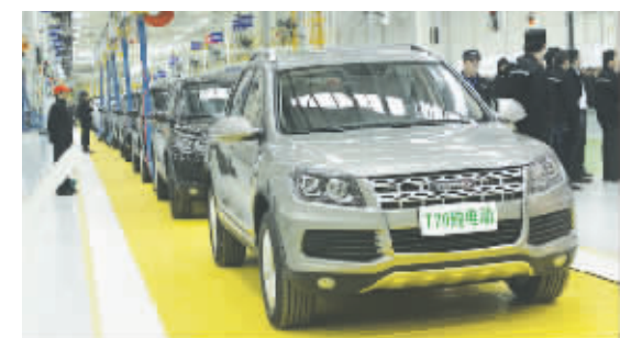
野马 T70 纯电动车

据悉,下一步,川汽还将在纯电动汽车充电网络建设、混合动力及纯电动汽车核心零部件的研发与制造上狠下功夫,以便能尽快打通新能源汽车的产业链。