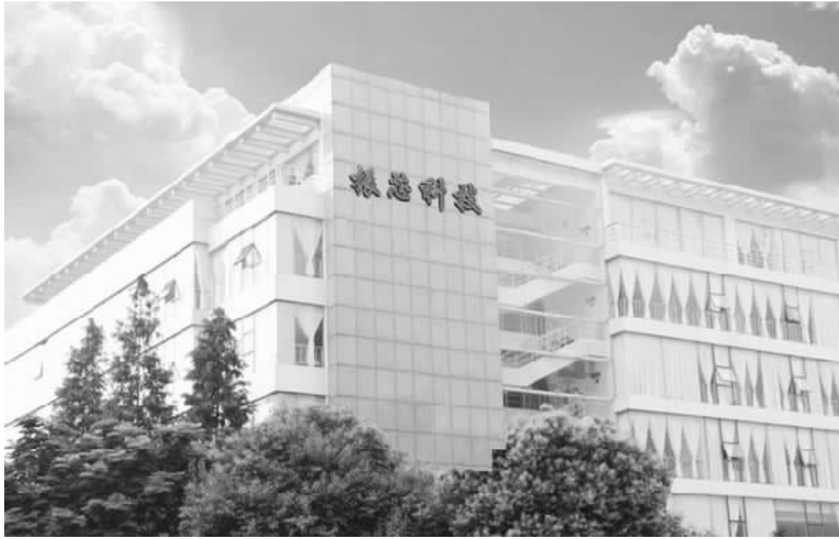
●成都上市公司振芯科技(资料图片)

按照规定,各市(州)科技部门和财政部门,要在下达的资金额度和规定期限内,组织辖区内区、县(含扩权强县)按照定向财力转移支付管理办法相关规定自主确定具体项目。项目应符合全省科技、经济和社会发展的需求,符合国