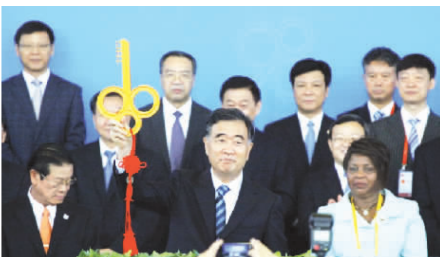
●9月8日上午9时8分,备受世界关注的第十八届中国国际投资贸易洽谈会在厦门开幕,中共中央政治局委员、国务院副总理汪洋开启投洽会金钥匙。

存量来看,与发达国家仍有较大差距。报告指出,2013年末,中国对外直接投资存量6604亿美元,位列全球第11位,但其存量规模仅为同期美国的10.4%,英国的35%,德国的38.6%,法国的40.3%,日本的66.5%。