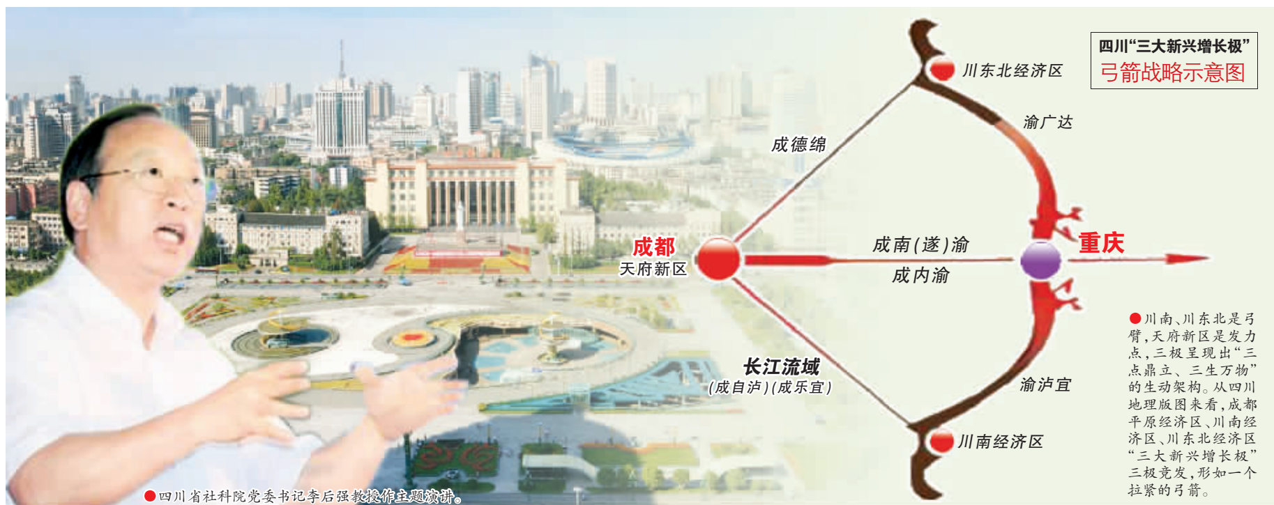
四川“三大新兴增长极” 弓箭战略示意图