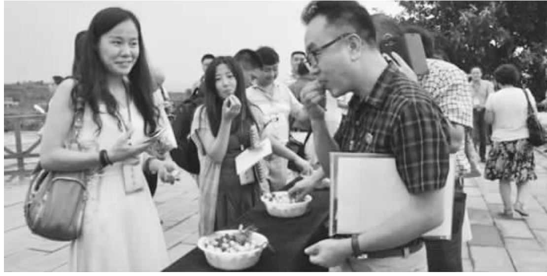
来自全国各地的百余家企业负责人赴三台考察农业项目。

关停热电公司的时间已经敲定。曾经, 建设城市最大的热电厂, 是上世纪绵阳人的梦想; 如今, 消除污染还城区一片蓝天, 是人们迫切的需要。“告别烟雾腾腾大烟囱, 这也是在为绵阳建设‘天蓝、地绿、水净、人和’的中国西部经济文化生态强市贡献力量。”罗杨贵如是说。