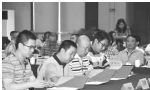
企业签订意向投资协议。