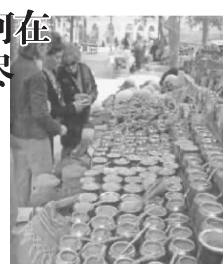
●市民在购买马黛茶茶具

我在乌拉圭的邻国阿根廷,东西南北跑了整整一个月,间或也能遇见喝马黛茶的人,但他们多居住在北部高原地区,在首都布宜诺斯艾利斯则极为罕见。不像乌拉圭,马黛茶的爱好者似乎全部聚集在首都。