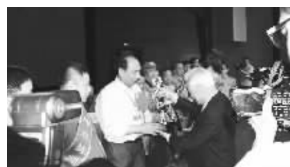
周铁农副委员长给马建华颁奖