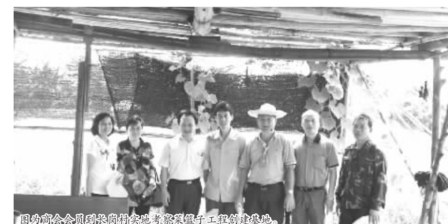
图为商会会员到长岗村实地考察菜篮子工程创建基地。