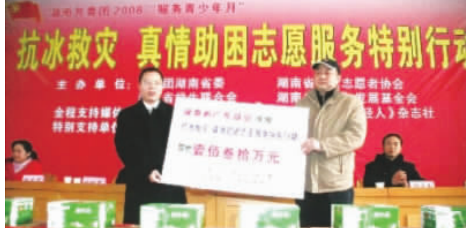
商会在湖南省抗冰救灾活动中捐赠130万元,商会成立以来累计捐款达7000万元。

商会利用自己熟悉湘粤两省的优势,主动配合政府工作。2013年8月,粤湘两省经贸签约仪式举办,商会多次协调争取到了协办此次活动后,精心策划和准备,活动取得了圆满成功,极大地鼓舞了在湘企业发展的信心。在广东当地产品来湖南进行推广时,商会挺身而出,协办活动。既为广东商品的推广出谋