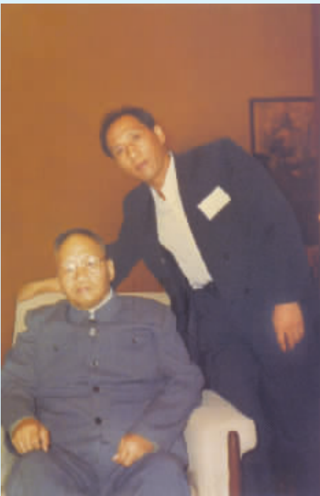
● 马建华与毛泽东次子毛岸青合影(1991年9月21日)