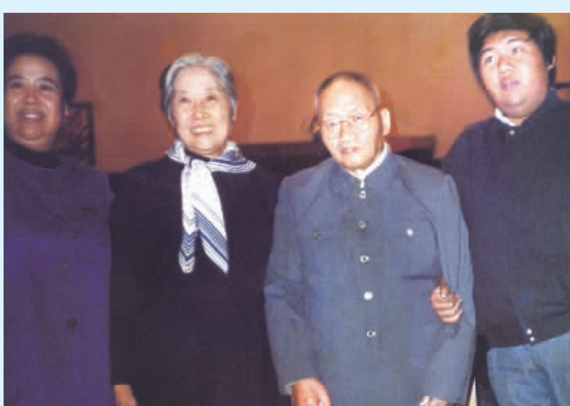
● 马建华在人民大会堂为毛泽东次子毛岸青、夫人邵华、孙子毛新宇及刘少奇夫人王光美摄影,这是全国首幅毛泽东、刘少奇两位国家领导人家属的合影照片,极为珍重(1991年9月22日)