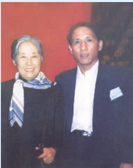
● 马建华与刘少奇夫人王光美合影(1991年9月21日)

近年来,在商海大潮中卓有成效的马建华在书友们的倡导下,尝试书法艺术,以文会友,陶冶情操。为了创艺好每一幅字,打造出自己的特色,他多次走近大自然去发现、体会和感悟,多次近距离观察鹤、竹、马的形