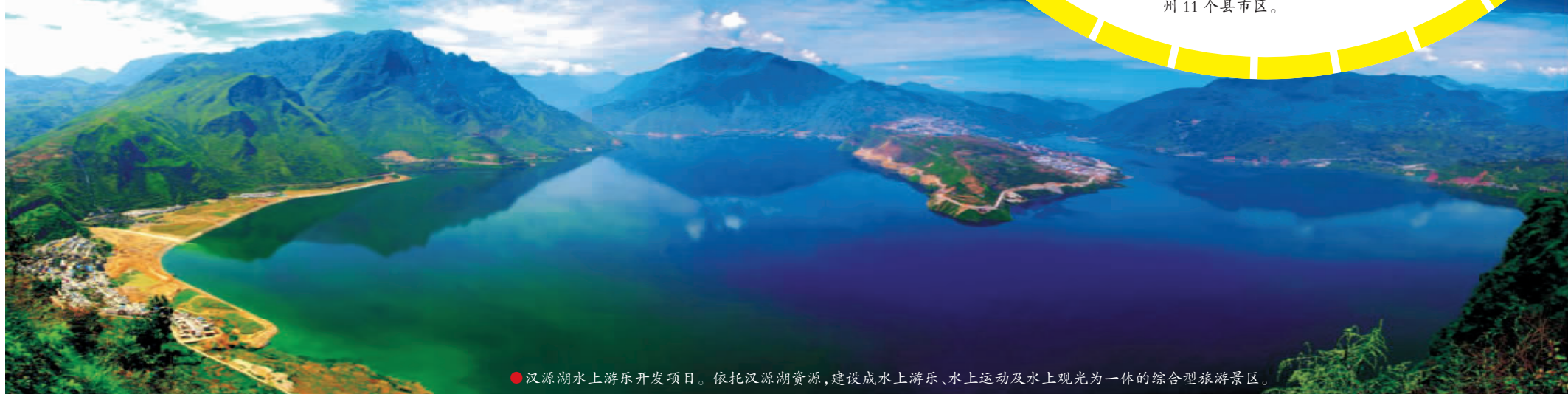
● 汉源湖水上游乐开发项目。依托汉源湖资源,建设成水上游乐、水上运动及水上观光为一体的综合型旅游景区。

攀西战略资源创新开发试验区:是全国唯一获准设立的资源开发综合利用试验区,规划面积近3万平方公里,范围包括攀枝花市全境,凉山州的西昌市、冕宁县、德昌县、会理县、会东县、宁南县,以及雅安市的石棉县和汉源县,共3市州11个县市区。