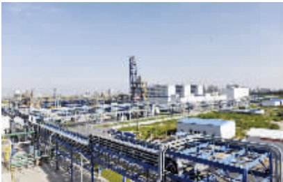
● 年产10万吨工业硅项目