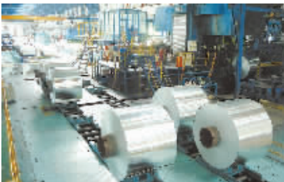
● 2万吨铝合金板生产加工项目