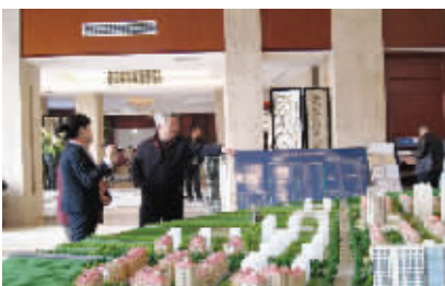
● 养老地产开发项目