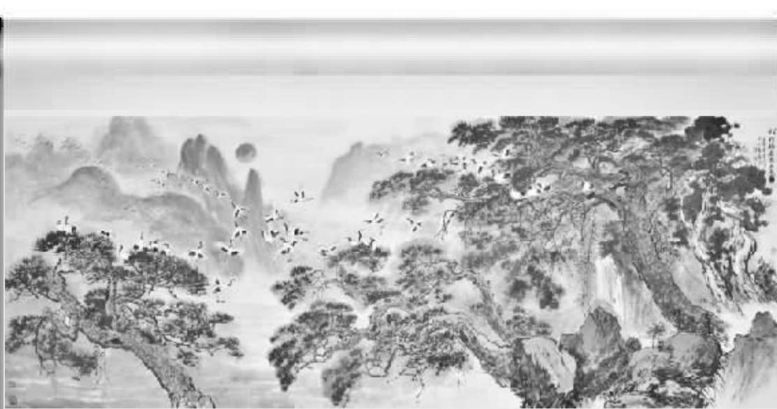
●松柏鹤长春三友图

(本文为作者:企业家日报广东记者站名誉站长,广州大学人文学院教授,广东省收藏家协会理事)