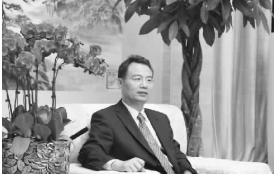
全国政协委员、全国工商联副主席徐冠巨

“她经济”，也就是“女性经济”，是教育部2007年8月公布的171个汉语新词之一。随着女性经济和社会地位的提高，围绕女性理财、消费而形成了特有的经济圈和经济现象。由于女性对消费的推崇，推动经济效果很明显，所以称之为“她经济”。现代女性拥有了更多收入和更多的机会，她们崇尚“工作是为了更好地生活”，不少女性喜爱疯狂购物，以信用卡还贷，成为消费的重要群体。