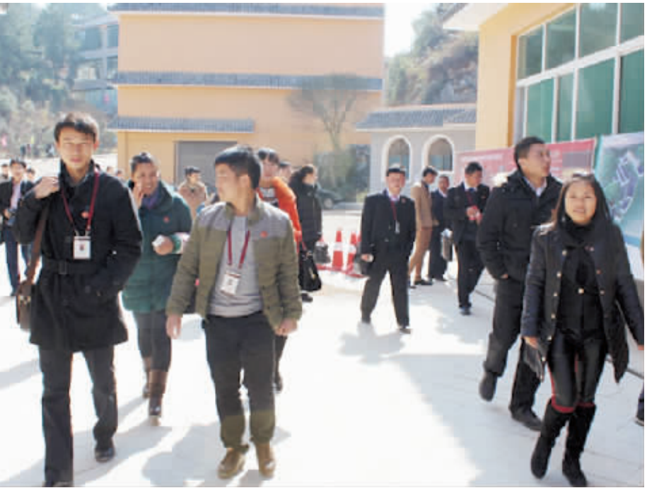
●百年原址酒业销售精英参观企业生产基地。