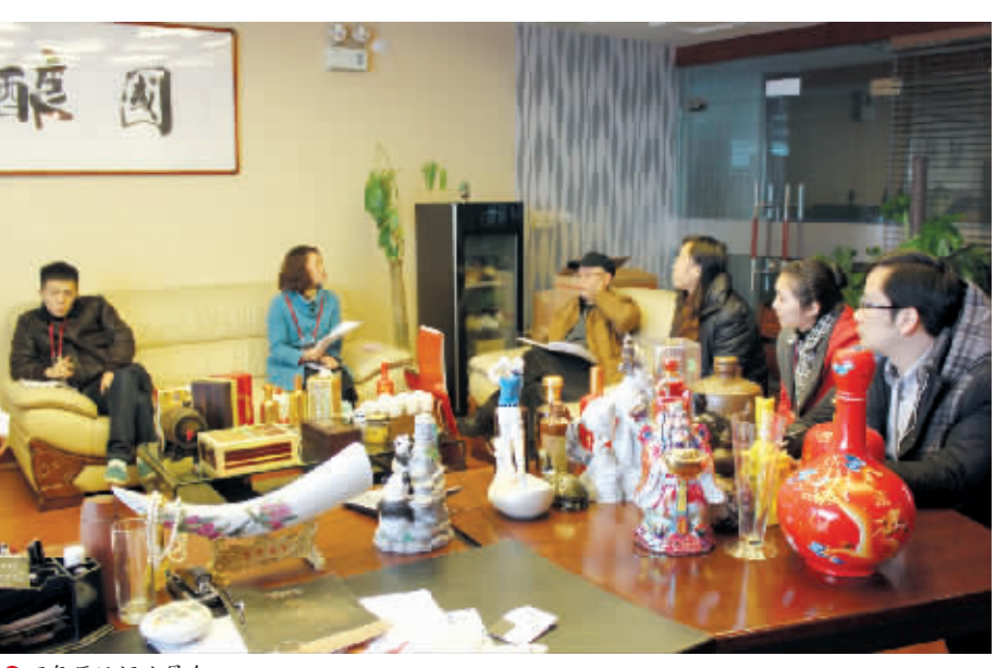
●百年原址酒业展会。