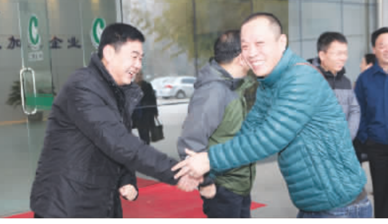
公司领导与员工们亲切握手,互道新年祝福。

寒风辞旧岁,瑞雪迎新春。2 月 9 日是许昌烟机公司春节假期后上班的第一天。早上 7 点半,顶着凛冽寒风,带着满腔热情,公司领导早早地在南厂区联合厂房及北厂区大门前迎接新年第一天上班的员工,并与员工们亲切握手,互道新年祝福。 随后,公司领导先后走访了南北厂区各分厂、部门及公司易地技改工地,亲切看望新年伊始工作在各个岗位上的员工。每到一处,公司领导都与大家亲切交谈,向他们恭贺新春,感谢大家过去一年为企业发展做出的积极贡献。一声声“新年好”表达了公司领导对全体员工的亲切问候与祝福,一张张真挚的笑脸,传递着员工们的激动心情。 在北厂区生产一线慰问后,公司领导还专门前往正在紧张修建的北厂区职工食堂,现场察看了施工进度。在公司易地技改项目工地走访时,公司领导与技改项目工作人员进行了座谈交流,详细了解项目进展情况,对项目施工进度作了明确要求,并强调要着重做好搬迁前的各项准备工作,为公司易地技改项目早日竣工投产做好充分准备。