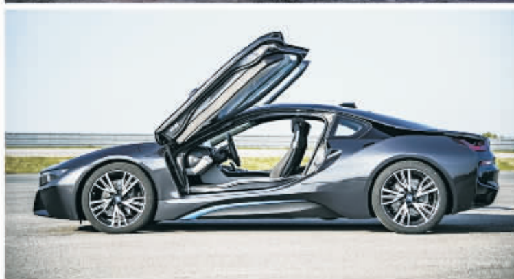
装设备, 燃油效率也更高。

车展上, 宝马集团特别展出了M Performance TwinPower Turbo直列六缸发动机的BMW M235i双门轿跑车, 最大输出功率可达240千瓦(326马力), 将该细分市场的驾驶性能标杆提高到全新境界。另一款BMW 228i配备使用BMW TwinPower Turbo涡轮增压技术的2.0升四缸发动