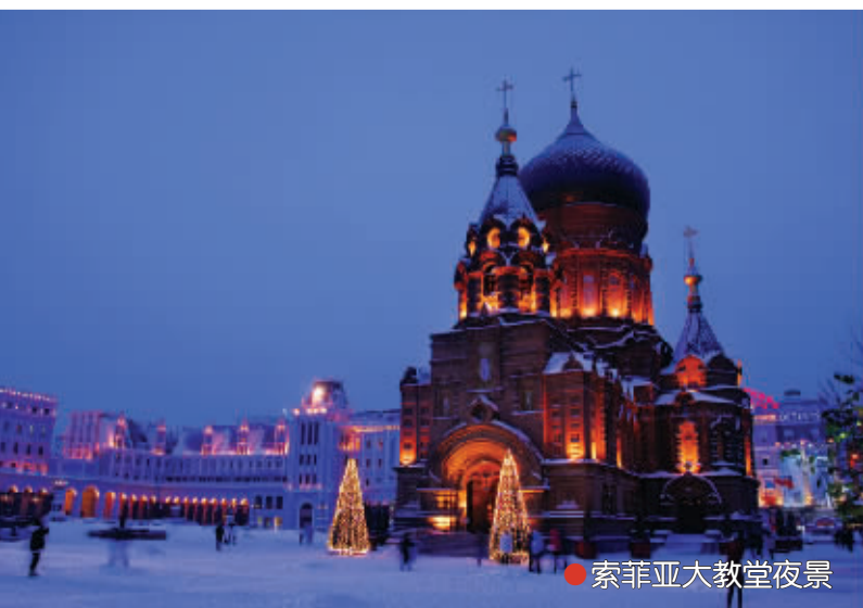
●索菲亚大教堂夜景