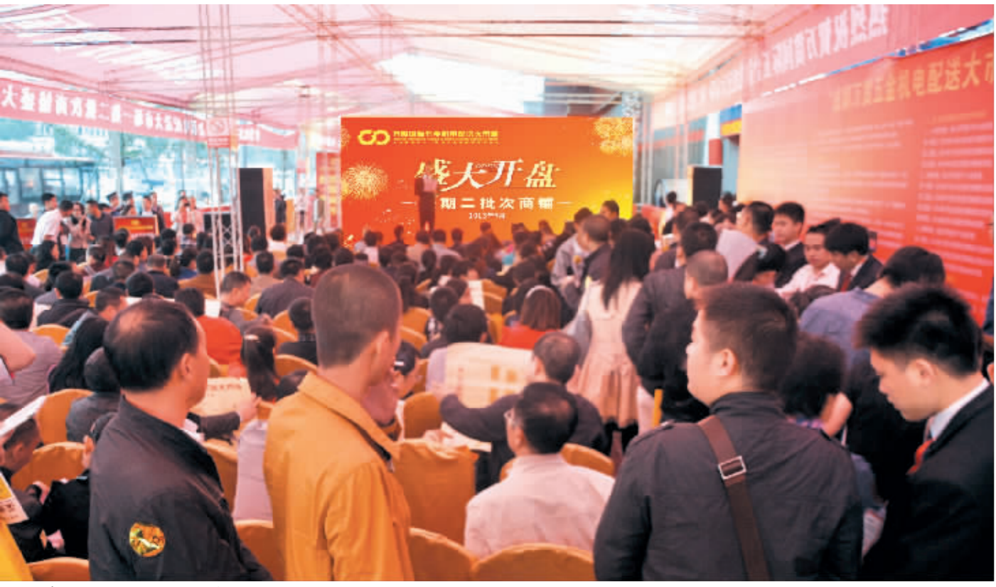
●万贯青白江项目一期二批次开盘现场