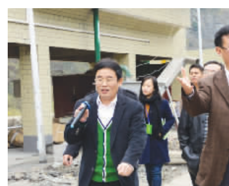
习酒公司领导向袁周一行汇报黄金坪污水处理厂基本情况。

2013年底,贵州省人大常委会副主任袁周率省环保、发改、交通、林业、水利等部门负责人来到习酒公司就环境保护工作进行调研。遵义市人大常委会副主任毛良知,习水县委书记曾瑜、县委副书记陈永清、副县长苟明利等市、县领导陪同。习